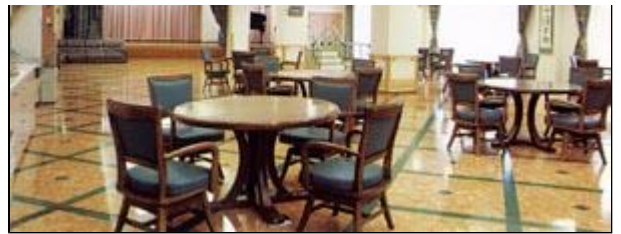
明るく清潔な雰囲気です。楽しく食事していただけます。