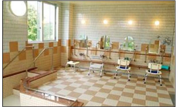
広々としたスペースで、入浴を楽しんでいただけます。